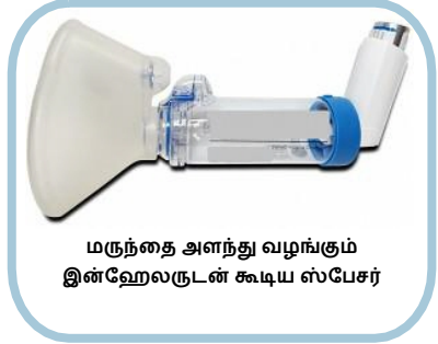
மருந்தை அளந்து வழங்கும் இன்ஹேலருடன் கூடிய ஸ்பேசர்

மருந்தை அளந்து வழங்கும் இன்ஹேலரைப் பயன்படுத்தும் போது சுவாசத்தை ஒருங்கிணைப்பது கடினமாக இருந்தால், இன்ஹேலருடன் சேர்த்து ஒரு 'ஸ்பேசர்' சாதனம் பயன்படுத்தப்படுகிறது. ஸ்பேசரில் வழங்கப்பட்ட மருந்தைத் தக்கவைத்துக்கொள்ளும் ஒரு வெற்று தேக்குமிடம் உள்ளது, இதனால் பயனர் மருந்தை மெதுவாக உள்ளிழுக்க அதிக நேரம் அனுமதிக்கிறது.